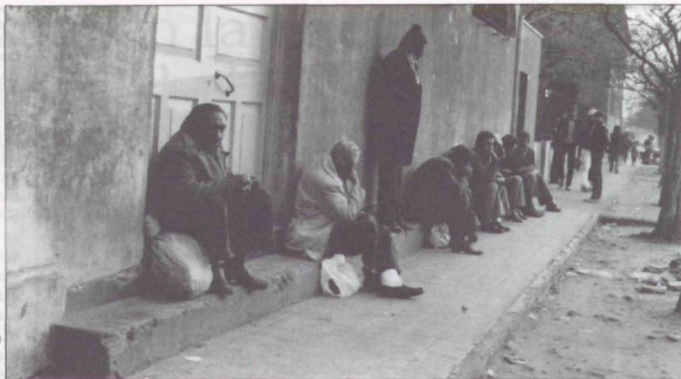
La función del Hogar es ser en la sociedad conciencia del problema de la miseria

ha pedido ayuda al exterior y que es sólo financiado por los chilenos. Las campañas más notables que hay con este fin, son la Campaña 1 a 1, donde se trata de crear solidaridad de las empresas con la sociedad global; la Cena Pan y Vino que es una gran ocasión para dar a conocer los problemas sociales del país; y las campañas de austeridad, ahorro y solidaridad que se lleva a cabo con los niños.