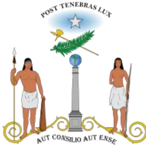
Imagen 1: Primer Escudo Nacional (1812)

Es así como en este momento a la clase dirigente chilena le sirve la imagen del indígena, para la construcción de su identidad por ser un símbolo de identidad común y fundacional que refuerza esta chilenidad ya que se ha Estado en conocimiento de la gran fuerza que ha tenido el indígena mapuche, en su resistencia contra el dominio español, y los siglos de maltrato que han sufrido estigmatizándolos de vándalos o inferiores, entonces decidieron ensalzar