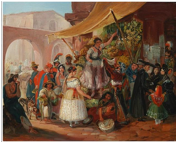
Imagen 4: La Reina del Mercado

actualmente se encuentra en el Museo Nacional de Bellas Artes de Chile, es La Reina del Mercado (imagen 4), en ella se aprecia la representación de diversos personajes de la idiosincrasia mexicana: damas con mantilla, religiosos, campesinos, y la atención, gracias al contraste de colores, se centra el escena compuesta por un hombre descalzo que vende pescado, y una mujer con un niño en brazos, sentada en el suelo. El crítico de arte Ricardo Bindis destaca que esta pintura posee una ejecución realizada con “toques rápidos a cada personaje, ya que el dibujo siempre está ofreciendo sus galas de habilidad para acentuar una fruta, limitar un personaje, definir las facciones de un rostro, por diminuto que sea el conjunto”. 59