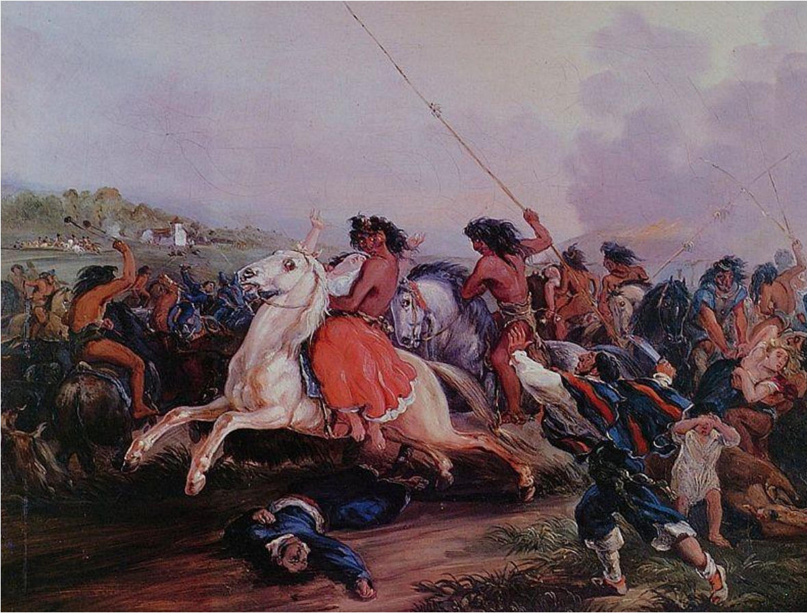
El rapto de Trinidad Salcedo / El Malón (1835) (Imagen 10)