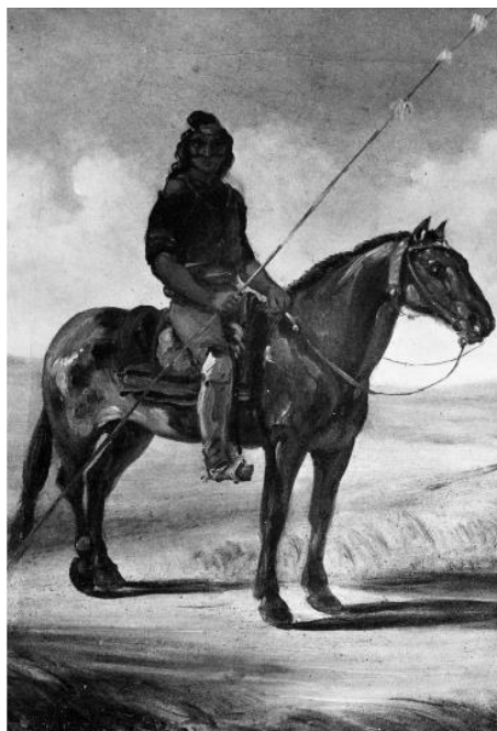
Imagen 5: Cacique Picunche

Gallardo también menciona que es muy probable que el nombre de Cacique Picunche sea posterior, ya que durante la época la denominación picunche utilizada para identificar a ciertos grupos de indígenas no era común aún.