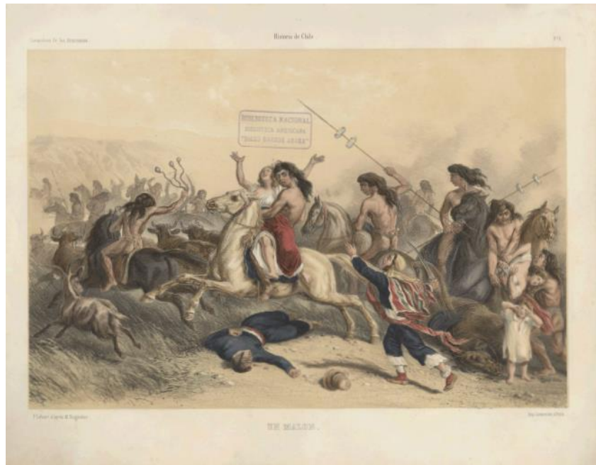
Imagen 11: Un Malón