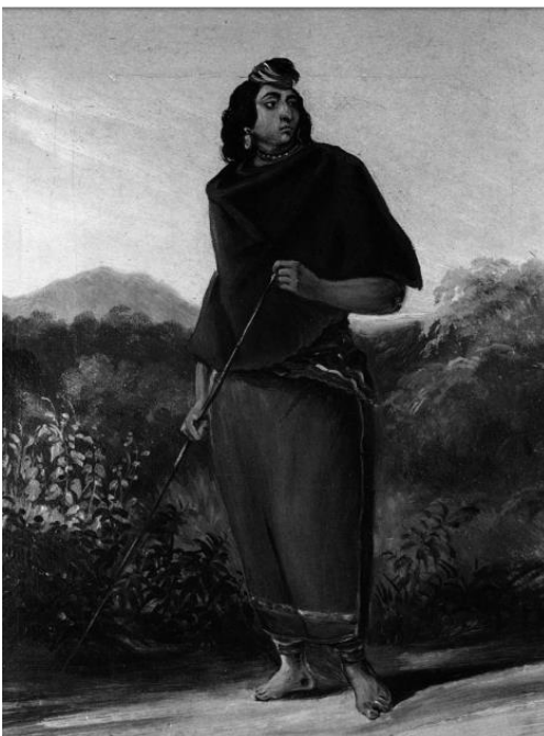
Imagen 7: Belleza Araucana

Y lo pintoresco se constituye en un camino para asimilar esta experiencia, vale decir, para domesticar lo desconocido y reorganizar lo desestructurado. El lenguaje artístico proporciona un instrumento mediador, que permite reacomodar la realidad de acuerdo con cánones predeterminados. 89