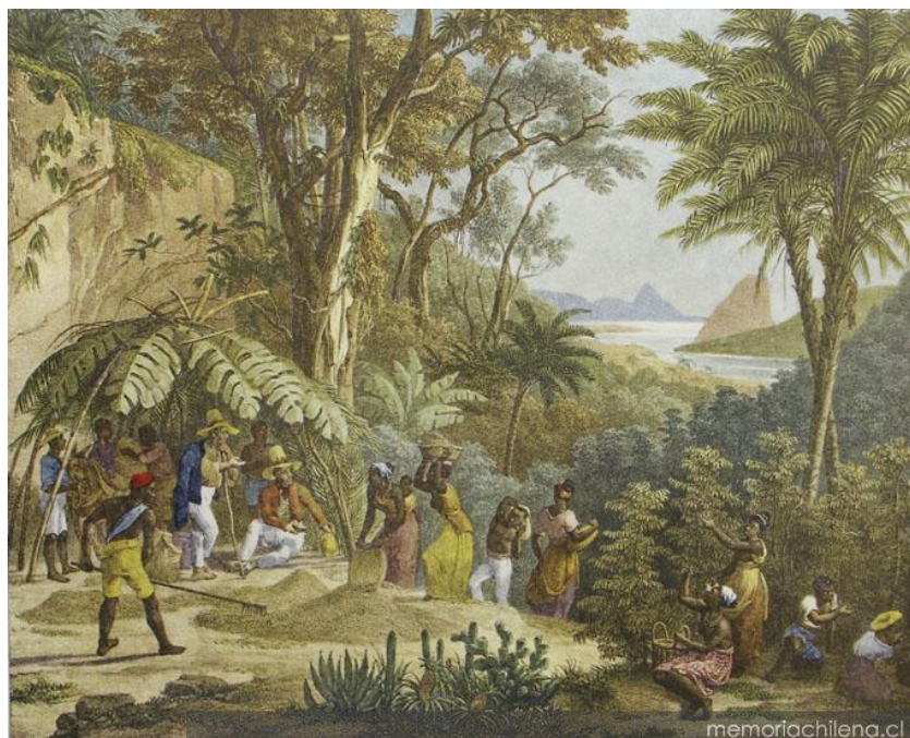
Imagen 3: Cosecha de café en Brasil

A su regreso en Francia, Rugendas publicó el álbum Voyage Pittoresque dans le Brésil , con 100 litografías originales realizadas durante la expedición, con el cual ganó fama y su trabajo fue ampliamente elogiado por la comunidad científica parisina. 58