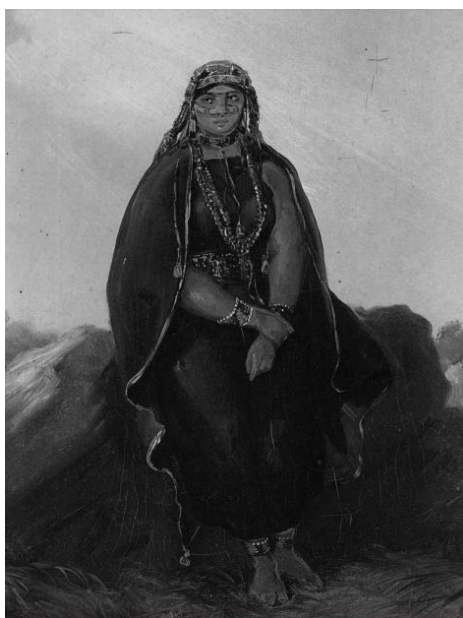
Imagen 6: Araucana

El küpan , un paño rectangular de lana negra envuelve el cuerpo femenino y está sujeto a un hombro con un alfiler. Es ceñido con una faja decorada o trarüwe y una manta negra o ukulla , cubre la espalda. Un delantal de género, es de uso más reciente. Ornamentos de plata: cintillos, aros, alfileres y pectorales, marcan su feminidad y el prestigio económico de su familia. 88