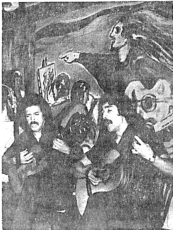
Contraposición a la cultura "oficial"

La cultura se da en la sociedad en conexión con las clases sociales, es una relación simultánea de expresión y conformación de la posición social de estos grupos. Siendo la sociedad una realidad conflictiva, el campo cultural no será unitario, sino atravesado de antagonismos. Esta contradicción de la conciencia de la sociedad se manifiesta tanto verticalmente, vale decir, por "la existencia de concepciones históricas de grupo", como horizontalmente, esto es al interior de un mismo grupo o clase social, siendo la disgrega-