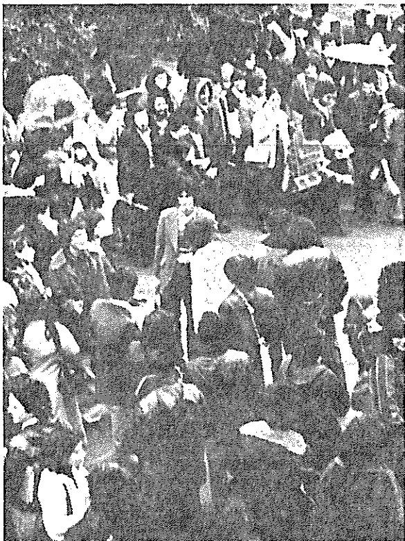
"Siempre se es hombre masa u hombre colectivo"

El concepto de "sedimentación" busca mostrar que en la cultura popular pueden permanecer activos elementos de concepciones del mundo correspondientes a épocas (o modos de producción) lejanos en la historia. Esto tiene una importancia metodológica al dar toda su riqueza al criterio anteriormente enunciado y tiene, también, impor-