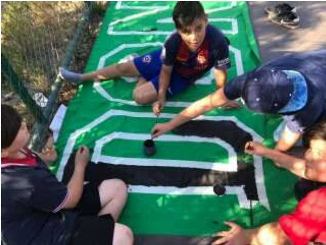
(Creación lienzo barrial 6/nov/2017)